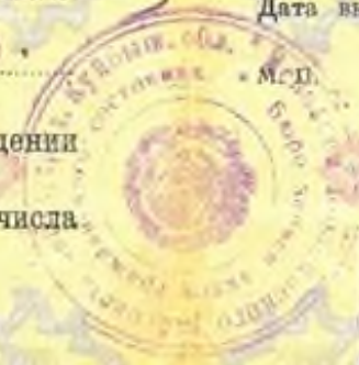
Свидетельство о рождении Эльдебеневаой Евдокии Николаевны (род. 19 февраля 1919 г.)

III-EP № 257137 Исходный РОД Кузбасской обл. ВЫДАН ПАСПОРТ V-EP 533146 серия 19 августа 78