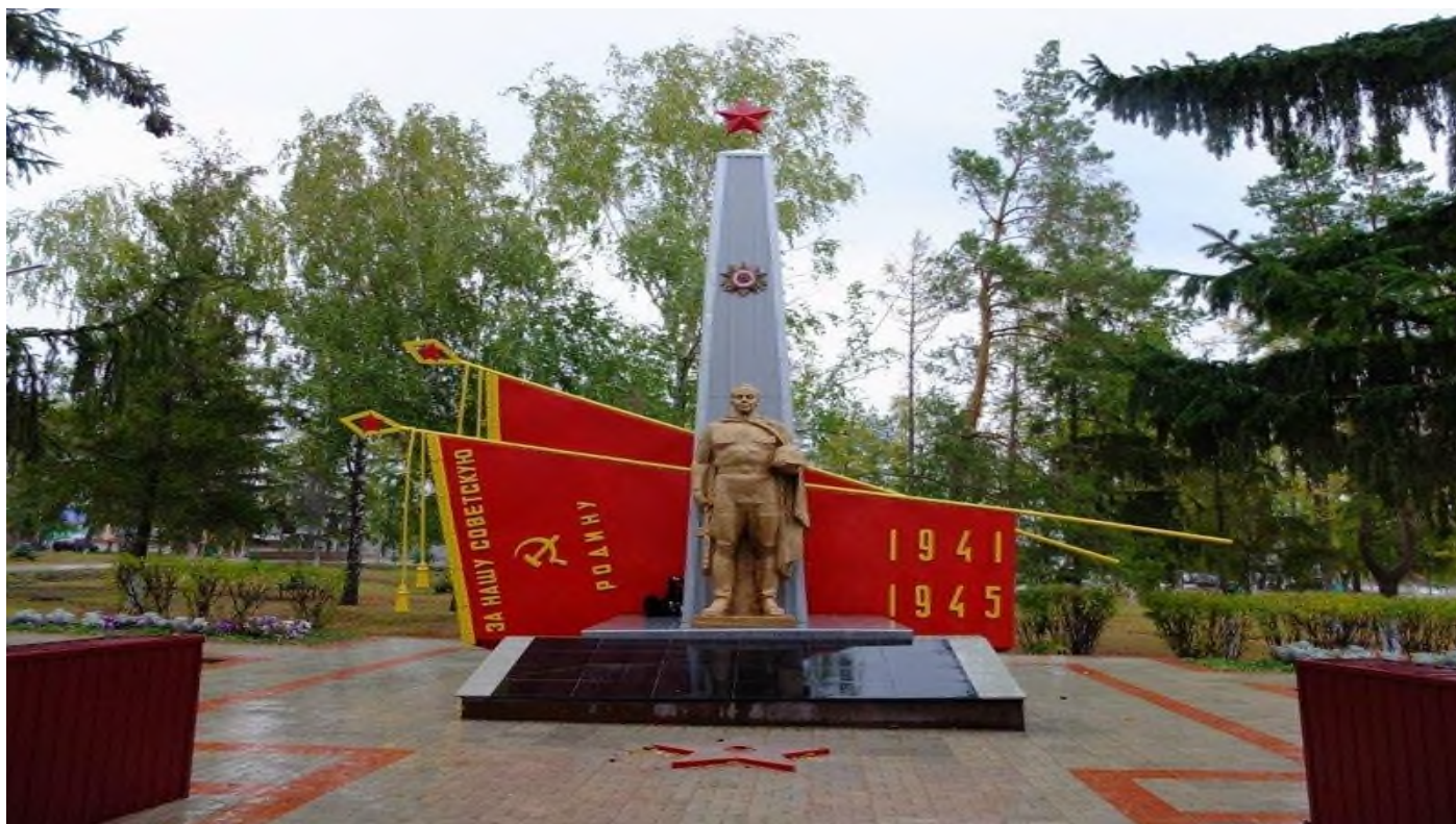
Памятник землякам, не вернувшимся с войны, с.Кошки