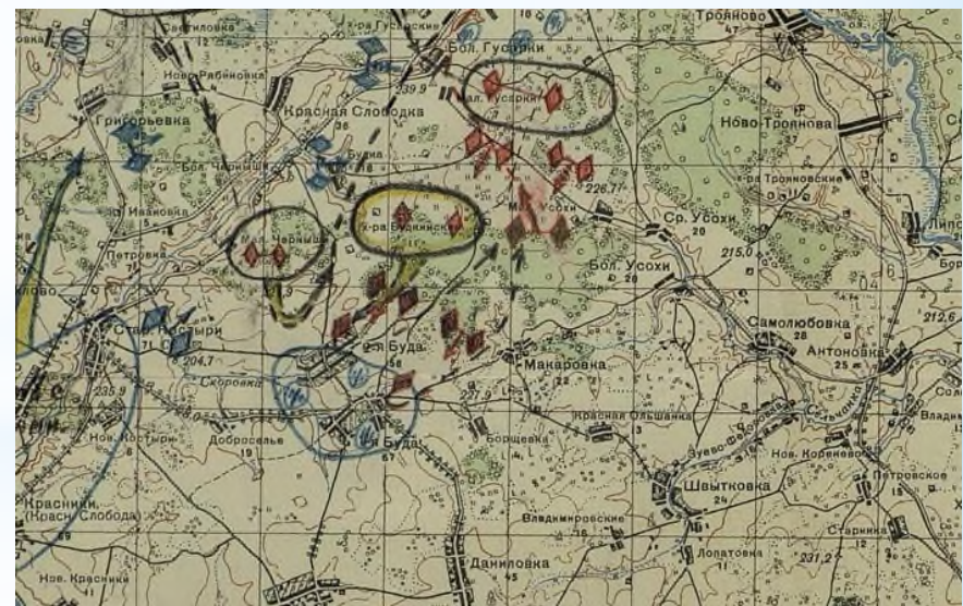
Карта боев 109 арт. Полка 109 танковой дивизии в 1941г.